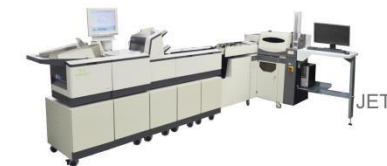
• MS1000 SERIES