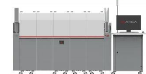
• S7000 JET