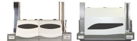
• S5200 SERIES