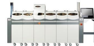
• S7000 SERIES